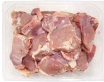
kip dij ontbeend zonder vel 2,5kg | 51.000.84