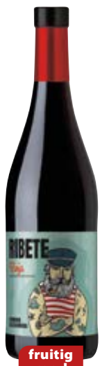
ZUAZO GASTON Ribete rioja 75cl | 08.910.16