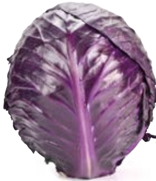
kool rood 59.212.00