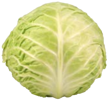
kool wit 59.216.00