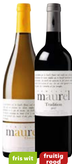
DOMAINE MAUREL • chardonnay 75cl | 08.500.78 • tradition rouge 75cl | 08.002.78