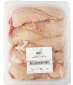
polderkip filet met vel 10 x ±180gr | 51.000.83