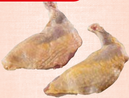
parelhoen supreme label rouge 2 x ±200gr | 51.003.85