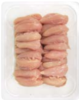
kip haasje ± 3kg | 34.799.55