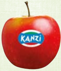
appel kanzi 58.010.00