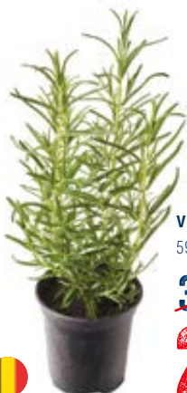
vb. rozemarijn plant 59.800.42