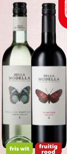
BELLA MODELLA • pinot grigio 75cl | 08.902.35 • primitivo rosso 75cl | 08.904.00