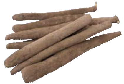
schorseneer inlands 59.000.33