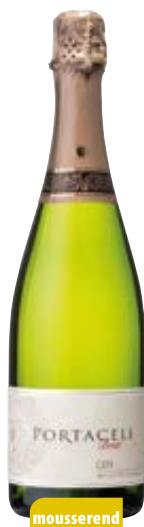
PORTACELI cava brut 75cl | 09.401.11