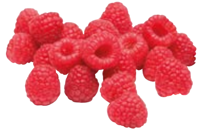
framboos 125gr | 58.120.05