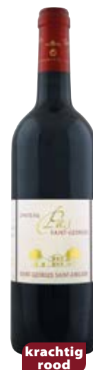
CHATEAU PAS SAINT GEORGES Saint-Emilion 75cl | 08.000.46