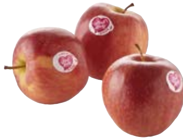
appel pink lady 58.010.25