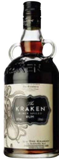
KRAKEN black spiced rum 40% 70cl | 05.400.11