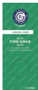
REPAIRE DES GOURMET eendenlever terrine 2 x 40gr | 34.700.36