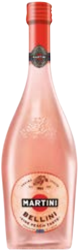
MARTINI Bellini perzik 8% 75cl | 09.400.54