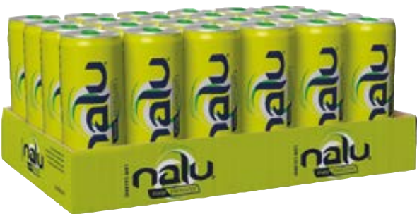
NALU fruity blik 24 x 25cl | 02.208.10