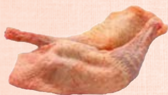
duif bout ± 500gr | 51.000.28