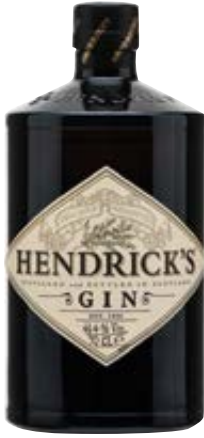
HENDRICK'S gin 41.4% 70cl | 05.300.02