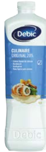
DEBIC culinaire koksroom 20% 2L | 34.904.30