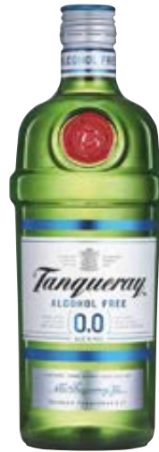
TANQUERAY gin 0% 70cl | 05.801.09