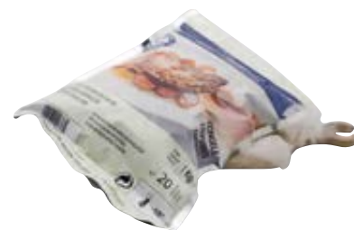
LE REPAIRE DES GOURMET escalope eendenlever 40 à 60gr 1kg | 36.900.95