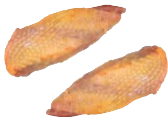
parelshoen filet met vel label rouge 10 x ± 140gr | 51.000.31