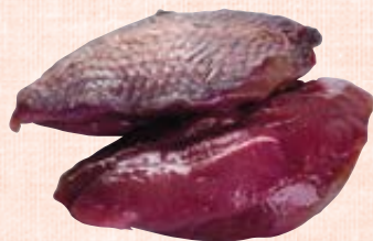
Flandrien duif filet met vel 12 stuks | 51.101.51