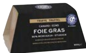
LE REPAIRE DES GOURMET eendenlever terrine truffel 500gr | 34.708.06