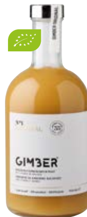
GIMBER Original N1 70cl | 20.100.19