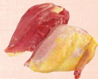
Anjou duif supreme ± 10x60gr | 51.000.80