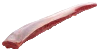
ree filet/striploin 2 stuks | 51.100.43