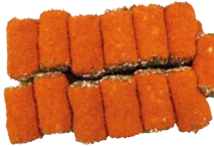
kip boomstammetje 13x120gr | 51.000.82