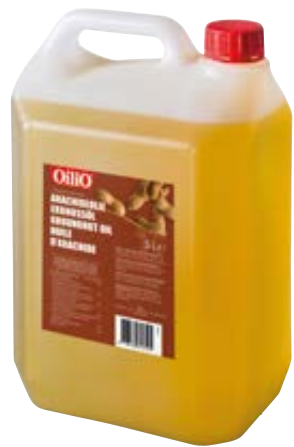
OILIO arachideolie 5L | 26.120.45