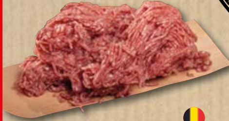
BOERGONDIE gehakt varken ± 5kg | 50.600.80