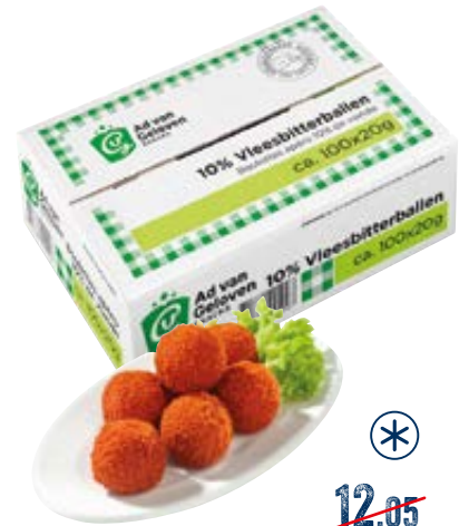
AD VAN GELOVEN 10% vleesbitterbal 100 x 20gr | 36.120.50