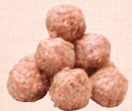
kip gehaktballetjes puur 40 x 25gr | 51.070.05