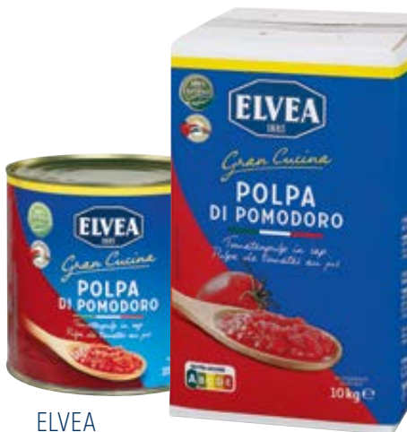
ELVEA tomatenpulp in sap