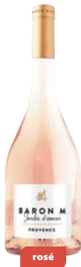
BARON M Jardin d'Amour rosé 75cl | 08.501.41