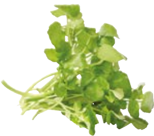
waterkers klein bot 59.116.00