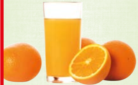
persinaasappel in doos 15kg | 58.300.11