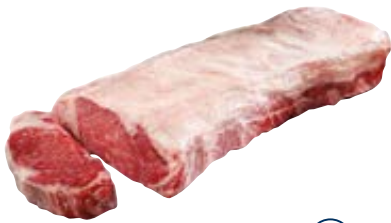
USA cornfed dunne lende ± 400gr | 36.908.14

Dagelijks verwerken onze slaggers in Brugge runds-, varkens-, kalfs- en lamsvlees tot ultraverse producten. Dankzij vakmanschap, korte keten en eigen beheer garanderen wij echte versheid!