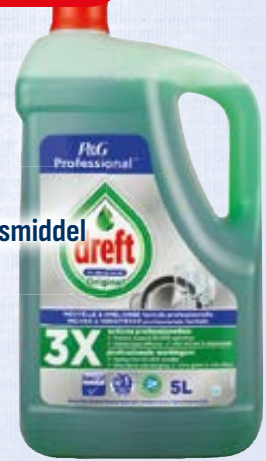
DREFT handafwasmiddel 5L | 32.120.40