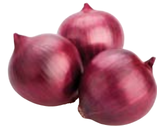
ajuin rood 10kg | 59.000.80