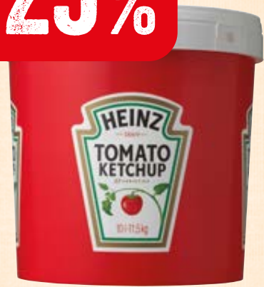
HEINZ ketchup tomaat 10L | 26.325.07