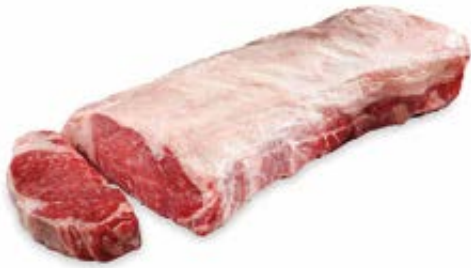
USA striploin grain fed ± 5,5kg | 50.000.29