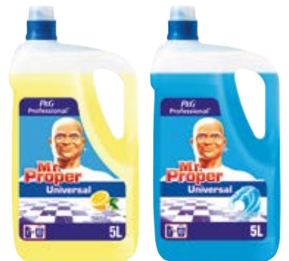
MR PROPER allesreiner citroen