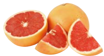
pompelmoes rood 58.300.05