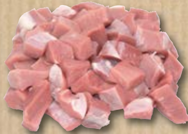
BOERGONDIE veau sous la mère stoofvlees ± 2,5kg | 36.908.09