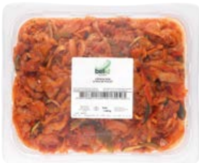
kip gyros ± 2,5kg | 34.317.51