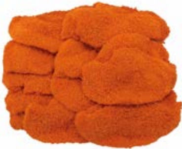
kip schnitzel 13x150gr | 51.000.76