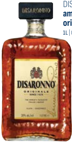
DISARONNO amaretto originale 28% 1L | 05.701.36