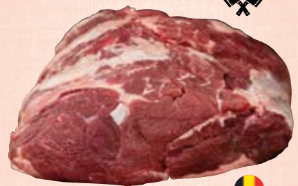
BOERGONDIE gerijpte entrecôte Charolais Rund ±3kg | 50.401.00