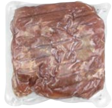
JEAN ROUTHIAU geconfijte varkenswangen ± 1,5kg | 34.701.20