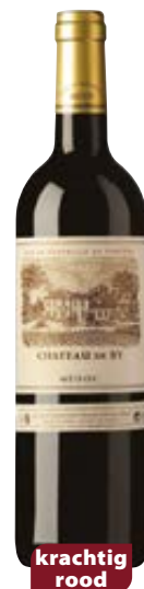
CHATEAU DE BY Medoc 2017 75cl | 08.001.25