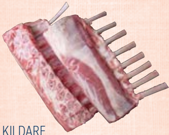
KILDARE Irish celtic lamb lamskroon korte snit texel ras 2 stuks | 50.200.02