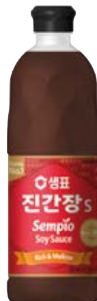
SEMPIO soja saus jin s 'rich & mellow' 860ml | 24.760.00