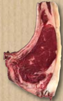
BOERGONDIE côte à l'os Normande gerijpt ± 1,1kg | 50.000.01