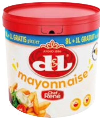
CHEF RENE mayonnaise 9L+1L gratis 10L | 26.390.06