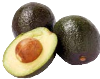
avocado ready to eat 58.112.00