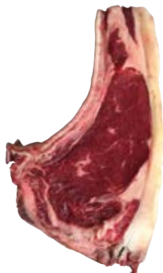
côte à l'os Normande 4 weken gerijpt ± 1,1kg | 50.000.01