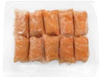
kip vinken 10x150gr | 51.000.85