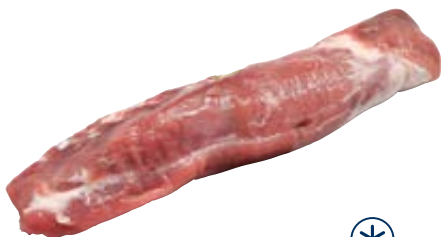
iberico solomillo varkenshaasje ± 400gr | 36.908.04