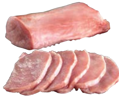
varkensfiletgebraad 3-4kg ± 3,5kg | 50.600.42