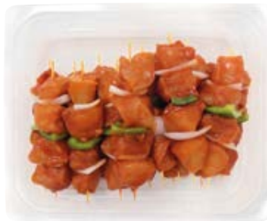
kip brochet paprika/ajuin 12x150gr | 51.000.77