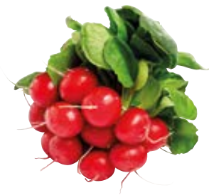
radijs rood 59.432.00