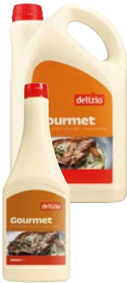
DELIZIO gourmet bakboter vloeibaar