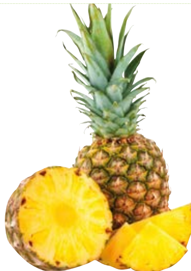
ananas sweet 58.600.01