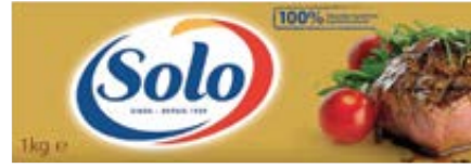
SOLO bakken & braden 1kg | 26.219.79