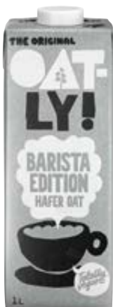
OATLY haverdrank barista 1L | 02.400.75