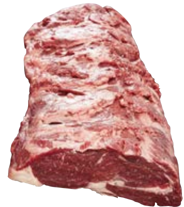
dunne lende Normande 4 weken gerijpt 3 à 5kg | 50.000.03