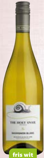
THE HOLY SNAIL sauvignon blanc 75cl | 08.400.25