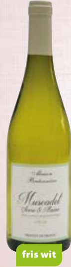
BRETONNIERE muscadet 75cl | 08.400.18