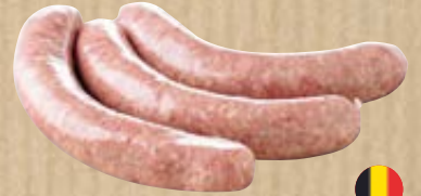
BOERGONDIE BBQ braadworst 10x125gr | 50.600.22