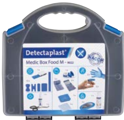
DETECTAPLAST ehbo medic box food horeca 40.001.07