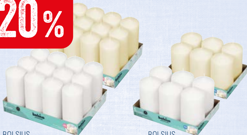
BOLSIUS stompkaars 68/168