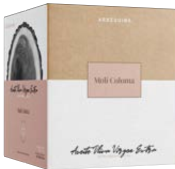
MOLI COLOMA olijfolie arbequina 100% 3L | 26.100.80