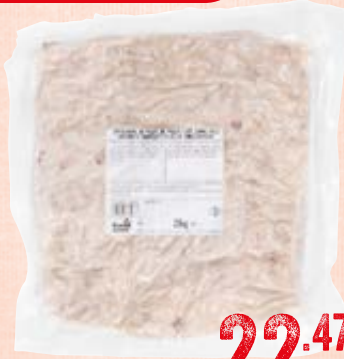
EUROPA CUISSON pulled kip natuur 2,5kg | 34.701.70