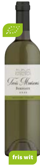
TROIS MAISON Bordeaux blanc 75cl | 08.903.46