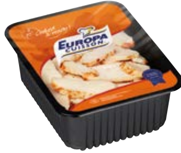
EUROPA CUISSON gebraden kipfilet schijfjes 1kg | 34.702.48