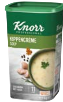
KNORR professional kippencreme soep 1100gr | 24.600.38