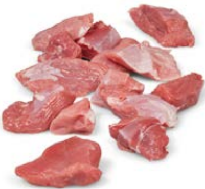
Texels lamsragout/ navarin ± 1,5kg | 50.200.57