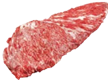
bavette 200d grain fed uruguay ± 1,2kg | 50.006.04