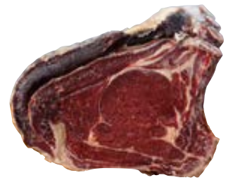
Charolais côte à 'los dry aged ± 1kg | 34.355.35