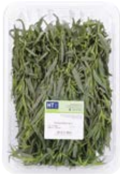
HTPRO FRESH dragon