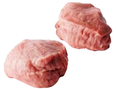
BOERGONDIE kalfsoester 2 x ± 200gr | 50.108.03