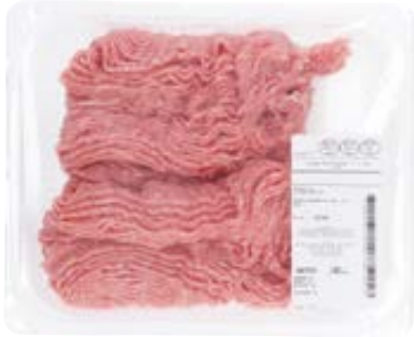
BOERGONDIE gehakt kalf/varken ± 2kg | 50.100.43