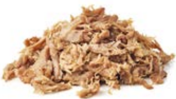
HTPRO CHEFS pulled pork 6 x 1kg | 36.906.01