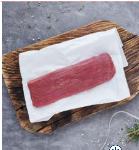
MASTER CHEF EDITION lamsfilet ontvlied ± 700gr | 36.904.47