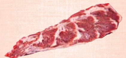
iberico pluma ± 450gr | 36.908.01