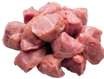
BOERGONDIE 100% duroc stooftvlees ± 1,5kg | 50.604.04